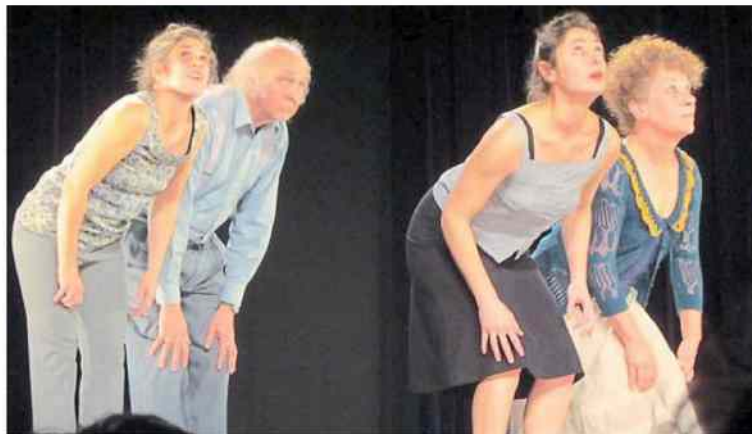
Le spectacle est joué samedi 12 décembre, au centre Jean-Vilar, à Angers.

Salle comble pour suivre le spectacle Vieux