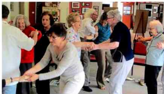
Les résidents de la résidence Bon-Air retrouvent les plaisirs de la danse.