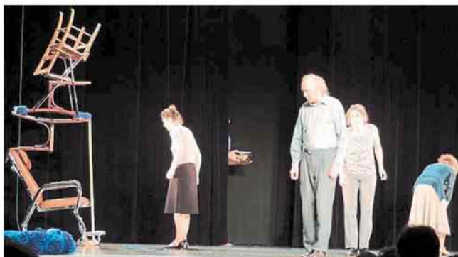
La compagnie angevine Osteorock constate que nous délaissions nos « vieux ».

Prochain rendez-vous de Villages en scène : « Parcours en utopie ! », soirée de petites formes orchestrée par Antoine Birot, à la Halle des marinières.