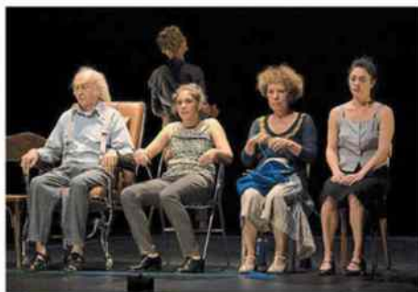
Les Ponts-de-Cé, dimanche 9 octobre. La compagnie angevine Osteorock a touché le public sur le thème de la vieillesse.

Attention : comme tous les spectacles, les réservations sont conseillées.